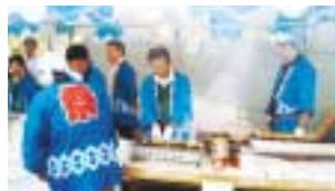
◀青梅ふれあい祭り2008